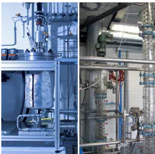
Abb. 2: Pilotanlagen bei EDL in Leipzig (links) und bei Sulzer in Allschwil (rechts)