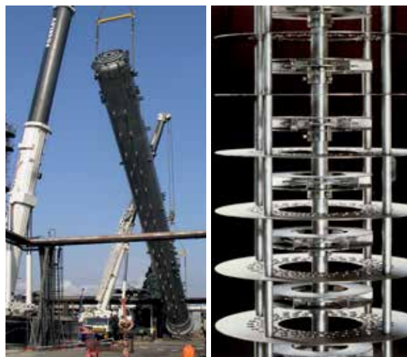
Abb. 3: Extraktionskolonne mit gerührten Einbauten Fa. Sulzer (links), hocheffiziente, gerührte Kolonneneinbauten Fa. Sulzer (rechts)

Mehr als 25 gerührte Extraktionskolonnen mit teilweise über 2,7 m Durchmesser werden weltweit erfolgreich für die Aromatenextraktion eingesetzt.