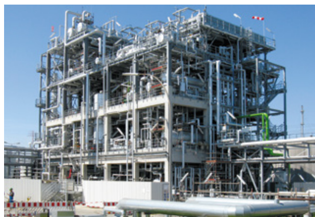
Abb. 2: Propanentasphaltierungsanlage (PDA), H&R Ölwerke Schindler GmbH, Hamburg, Deutschland

Beim Solvent Deasphalting werden in einer Extraktionskolonne die Asphaltene aus den Einsatzprodukten entfernt. Das dabei entstehende entasphaltierte Öl (DAO) wird in weiteren Verfahrensstufen zu Basisölen oder Kraftstoffen verarbeitet. Der anfängliche asphaltenreiche Pitch kann zu Bitumen mittels Biturox®-Verfahren oder mittels Blending weiterverarbeitet werden, je nach eingesetztem Rückstand und benötigter Bitumenqualität. Mit „SDA PLUS“ bieten wir eine SDA-Technologie sowohl für unterkritischen als auch überkritischen Betrieb an. Letztere ermöglicht geringere Betriebskosten, erfordert jedoch einen höheren Investitionsaufwand (Abb.1).