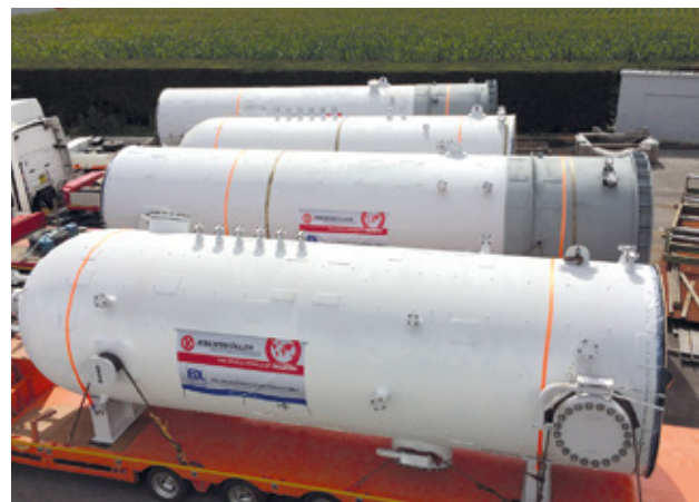
Abb. 4: OAO Naftan, Nowopolozk, Belarus: Engineering und Lieferung von zwei Extraktionskolonnen für Umbau PDA-Anlage