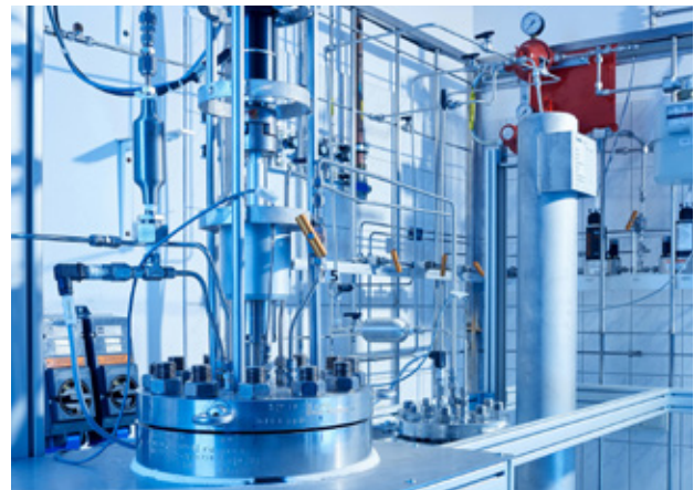
Abb. 3: Pilotanlage der EDL in Leipzig, Deutschland

Zur Effizienzsteigerung und Erzielung optimaler Produktqualitäten werden modernste Kolonneneinbauten eingesetzt. Die Optimierung der Prozesse und die Verwendung von State-of-the-Art-Technologie sichert eine Ausbeutesteigerung von bis zu 10 % bei Bestandsanlagen. Die Betriebskosten werden durch den Einsatz effizienter Technologien um bis zu 25 % gegenüber herkömmlichen Technologien verringert.